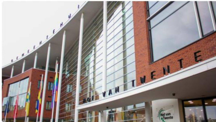
Het gemeentehuis van Hof van Twente in Goor

22 september, 15:00 • 3 minuten leestijd